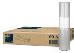
Tork Bin Liner 70L 995